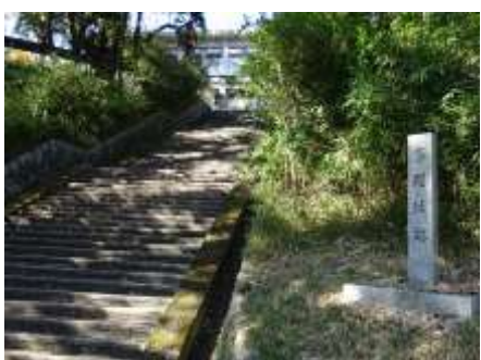
多聞城跡