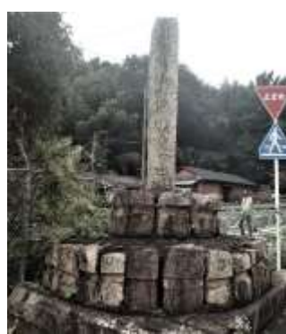
京津国道改良工事記念碑