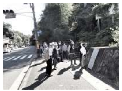
栗田口刑場跡付近