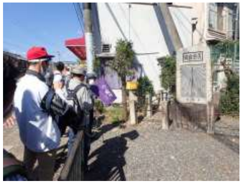
日時計(天智天皇陵)