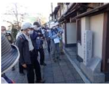
龍馬・御龍結婚式場跡